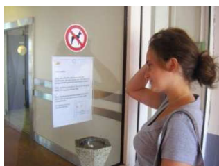
lecture depuis l'extérieur...

Clip'Window reprend les caractéristiques de Clip'Info et y ajoute la possibilité d'une lecture recto verso de l'information placée dans l'étui. L'étui est fixé sur 1 surface vitrée (vitrine, porte...) par encliquetage sur 1 mini clip permettant une lecture depuis l'extérieur comme depuis l'intérieur.