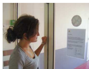
... comme depuis l'intérieur